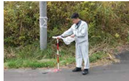
ゲルマニウム半導体検出器(写真左)を用いた放射能測定の様子(写真右上) サーベイメータによる空間線量率測定の様子(写真右下)