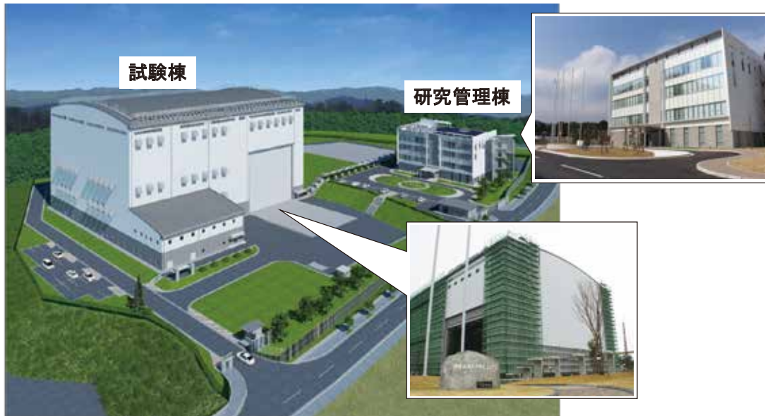
※写真は平成27年10月現在