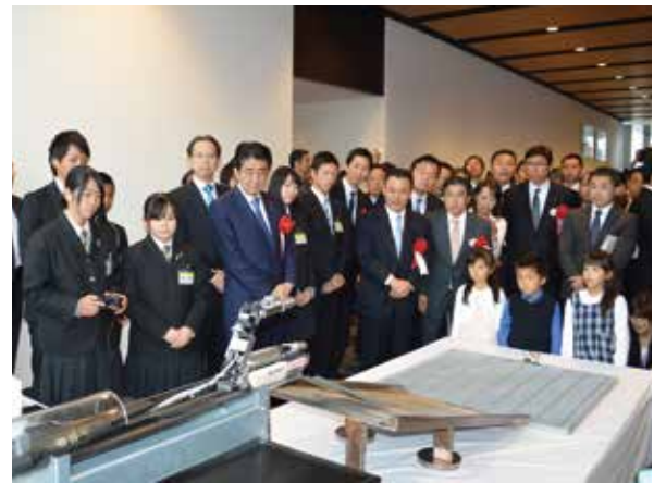
開所式後には、原子炉格納容器内を調査するサンリ型ロボット（I R I D/東芝製=写真左）のデモが行われました。

来年に完成する試験棟では1Fの建屋内作業環境を実物大で模擬し、モーションキャプチャーを使ってロボットの動きを精密に計測するなど、ロボットを実際に動かして機能の確認や、操作者が操作に習熟するための訓練などを行う予定です。