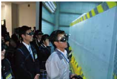
バーチャルリアリティシステムのデモの様子