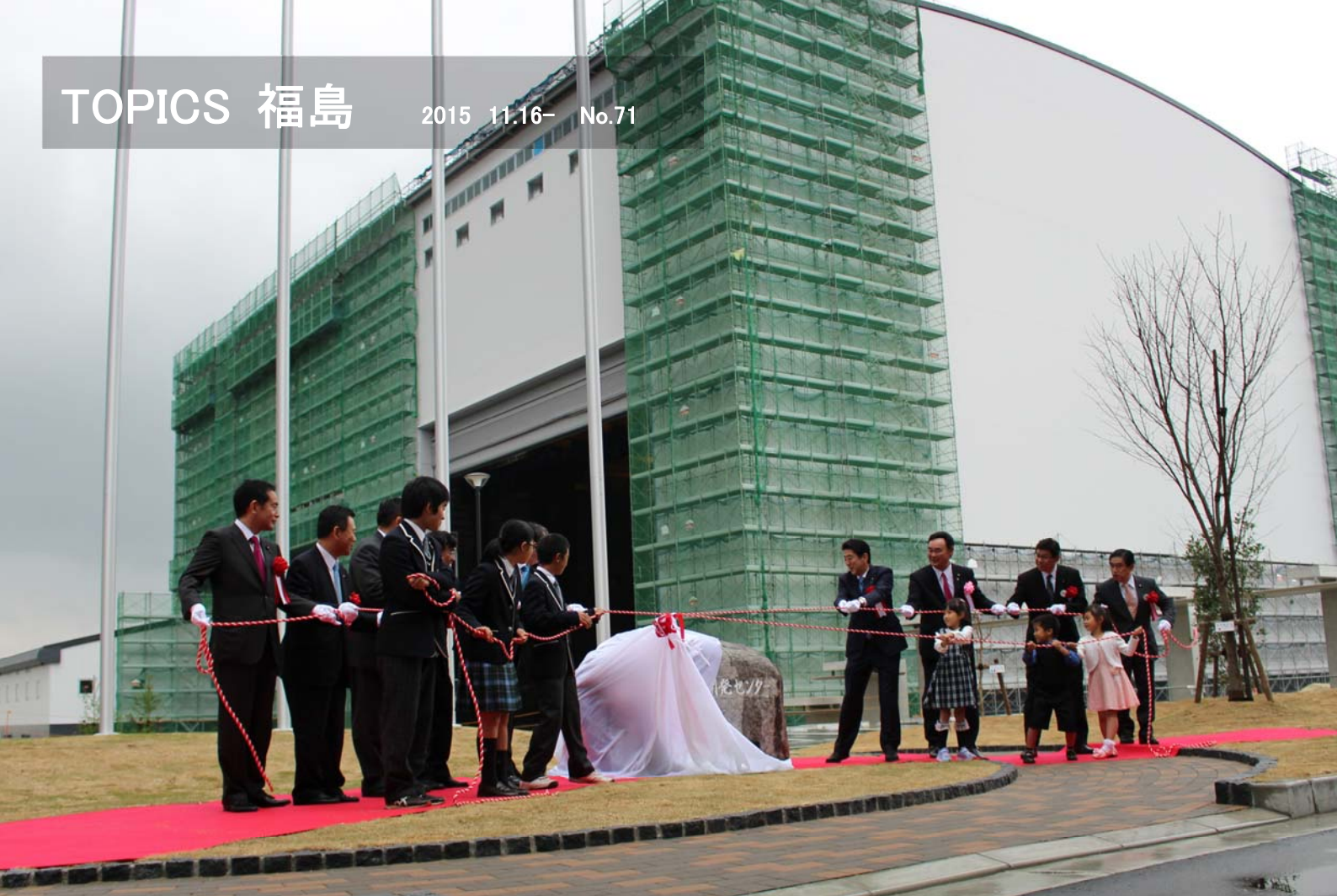
建設中の試験棟を背景に除幕式を執り行う様子（＝写真上）