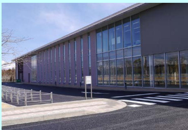
富岡町文化交流センター「学びの森」