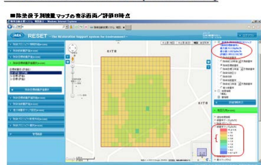
【図2】除染効果を予測