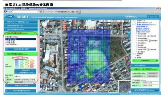
【図1】除染手法を入力