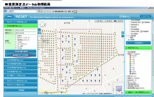
【図3】線量の追加測定推奨地点を表示

(注) RESETは、除染活動支援システム (The Restoration Support System for Environment) の略称。